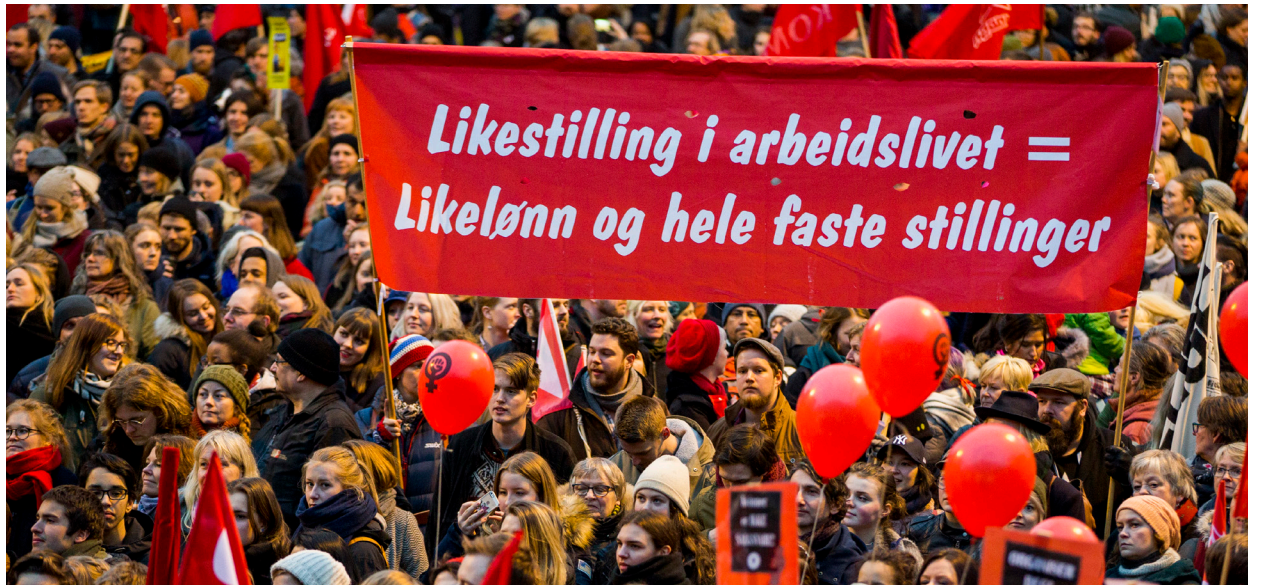
Likelønn: Ingen likestilling uten likelønn.