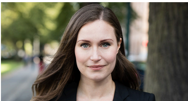
Vil ha kortere arbeidstid: Finlands statsminister Sanna Marin.