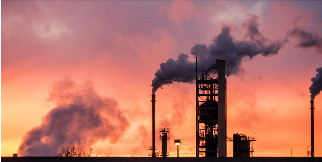
Utslippskutt: Klimapolitikken må være sosial og rettferdig.