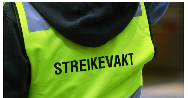
Streik: Tre ansatte ved Oslo regnskapskontor streiker for tariffavtale.